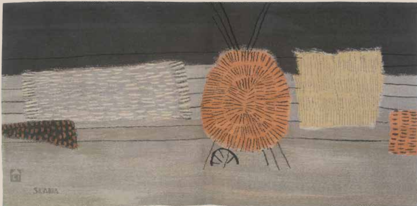
FRANCE SLANA, Tapiserija V, 1965. 97 x 212 cm, vuna, klečana tehnika Signatura: lat. dole levo; monogram A61 dole levo Inventarni broj: 010/70/1965/I Koautori: Isakov Ružica, Lazić Smilja, Horvat Ana Vlasnik: "Atelje 61"