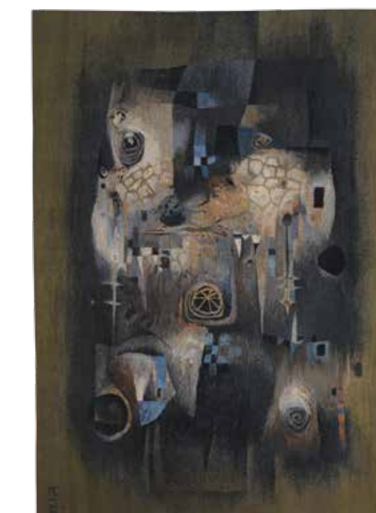
ИСИДОР ВРСАЈКОВ, Татисерија II (1966) вуна; клечано; 295 × 210 cm изведено под руководством Етелке Тоболке Завичајна галерија, Музеј града Новог Сада