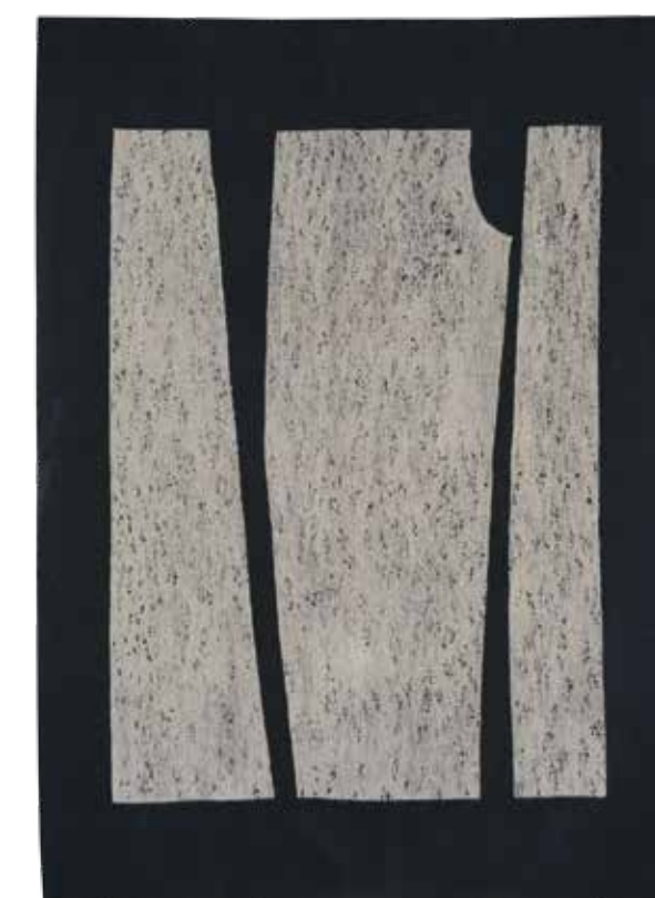
МИЛЕТА ВИТОРОВИЋ, Татисерија (1972) вуна; клечано; 246 × 177 cm Завичајна галерија, Музеј града Новог Сада