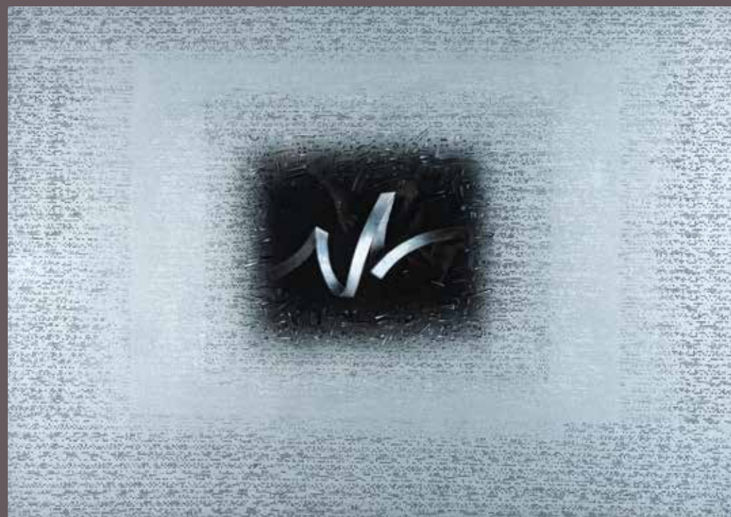
МИЛАН КЕШЕЉ, Знаци за будућност (1984) угаљ, бела креда, оловка на папиру; цртеж; 70 × 100 cm Завичајна галерија, Музеј града Новог Сада