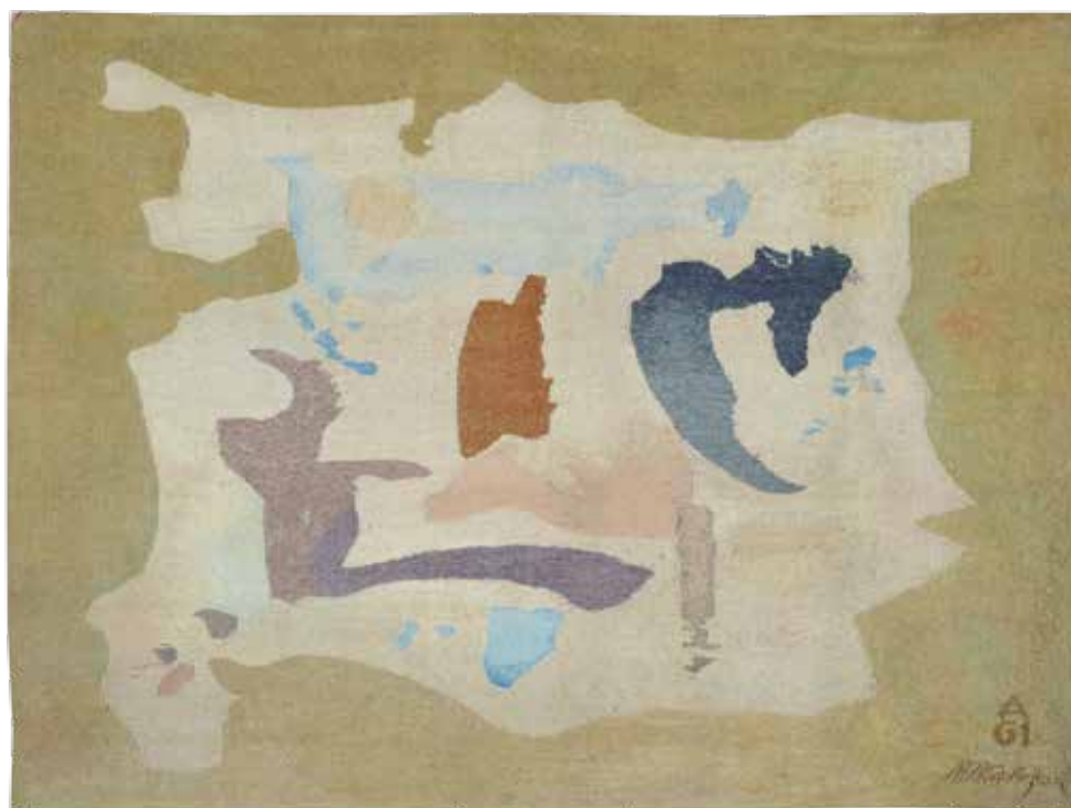
МИЛИВОЈ НИКОЛАЈЕВИЋ, Таписерија (1966) вуна; клечано; 158 × 208 cm Завичајна галерија, Музеј града Новог Сада