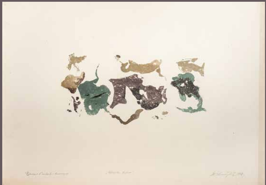
МИЛИВОЈ НИКОЛАЈЕВИЋ, Широке форме (1968) каменорез на папиру; 47 × 68 cm Завичајна галерија, Музеј града Новог Сада