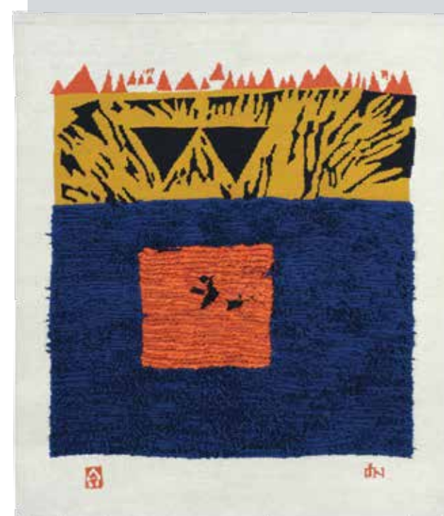
МИОДРАГ НЕДЕЉКОВИЋ, Седми хоризонт (1970) вуна; клечано; узлано; 170 × 145 cm ткаље: Видосава Остојић, Ружица Исаков Завичајна галерија, Музеј града Новог Сада