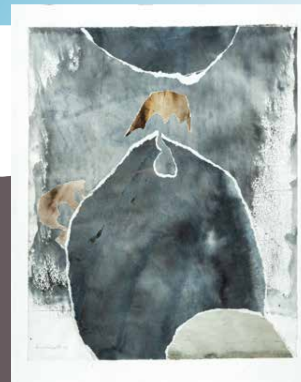
БОШКО ПЕТРОВИЋ, Колаж (1967) колаж, папир; 62 × 50 cm Завичајна галерија, Музеј града Новог Сада