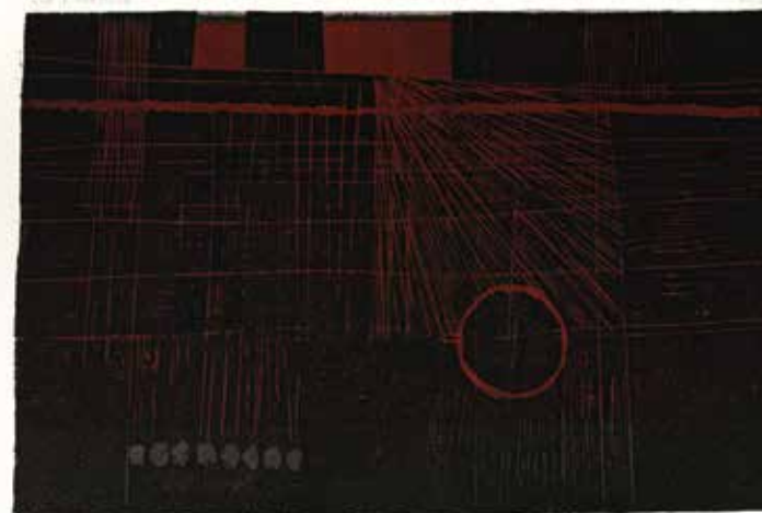
АНКИЦА ОПРЕШНИК, Летњи дан (1965) дрворез у боји на папиру; 27 × 40,5 cm (36,5 × 51 cm) Завичајна галерија, Музеј града Новог Сада