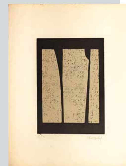
МИЛЕТА ВИТОРОВИЋ, Сиве вертикале (70-их 20. века) дрворез на папиру; 37,8 × 26,5 cm (65,2 × 50 cm) Завичајна галерија, Музеј града Новог Сада