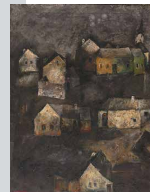
ИСИДОР ВРСАЈКОВ, Село (1963) уље на платну; 81,5 × 65 cm Завичајна галерија, Музеј града Новог Сада