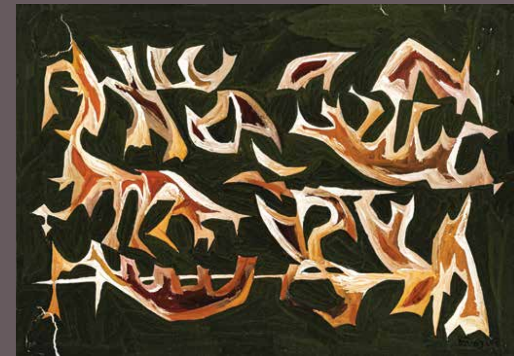
БОШКО ПЕТРОВИЋ, Скица за таписерију II (1963) темпера на папиру; 21,5 × 30,5 cm Завичајна галерија, Музеј града Новог Сада