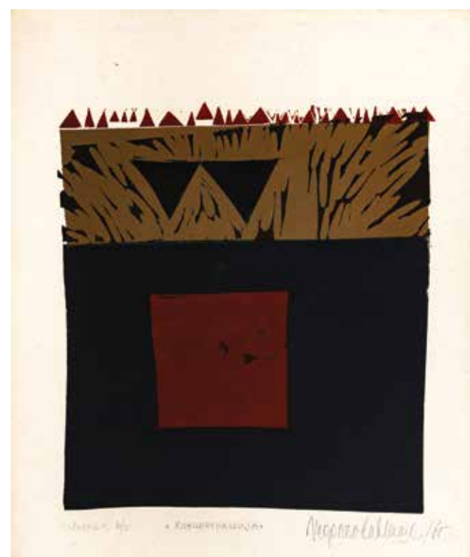
МИОДРАГ НЕДЕЉКОВИЋ, Концепција (1965) линорез на папиру; 43,5 × 39 cm (59,5 × 49,5 cm) Завичајна галерија, Музеј града Новог Сада