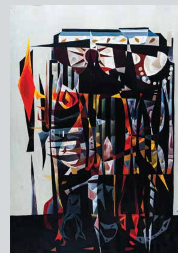
БОШКО ПЕТРОВИЋ, Петроварадин (1963) темпера на папиру; 100 × 70 cm Завичајна галерија, Музеј града Новог Сада